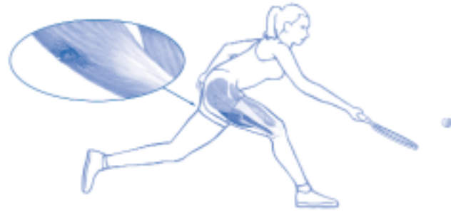
figuur 1. De hamstringblessure

De mate van ernst van de spierscheur wordt uitgedrukt in graden: graad 1, 2 of 3. Graad 1 is een milde spierscheur. Er is een lichte 'verrekking' zonder zichtbare scheur (deze is microscopisch klein). Er is geen duidelijk krachtsverlies. Graad 2 is een matige spierscheur, met duidelijke verscheuring van spiervezels en optreden van krachtsverlies. Graad 3 is een totale ruptuur van de spier. Dit komt gelukkig niet zo vaak voor. Herstel kan twee tot twaalf weken of meer in beslag nemen, afhankelijk van de ernst van de blessure en de leeftijd van de speler. Bij spelers boven de dertig jaar neemt de kwaliteit van het weefsel af en duurt het herstel vaak langer.