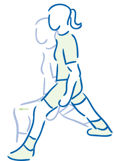
figuur 4. De uitstappas