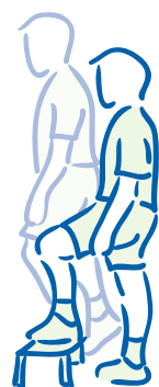
figuur 5. De opstappas